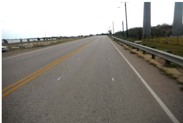
Figura 5. Carretera Pflugerville Pkwy (Carril Este)

La sección 2 está compuesta por un pavimento de asfalto y está ubicada en la carretera E. Pflugerville Pkwy. Las coordenadas de esta sección son Lat -30°26'20.83" Norte y Long - 97°34'40.68" Oeste en Austin, Tx. La Figura 5 muestra esta sección que es representativa de un pavimento con rugosidad media.