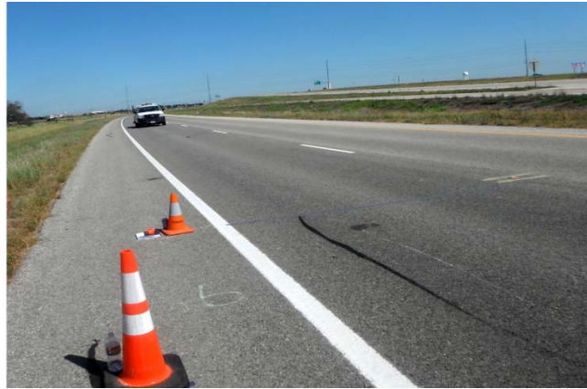
Figura 4. Carretera SH 130 (Carril Sur)

La sección 1 está compuesta por un pavimento de asfalto y está ubicada en la carretera SH 130 en Austin, Texas. Las coordenadas de esta sección son Lat - 30°26'40.28" Norte y Long - 97°35'39.22" Oeste. En la Figura 4 se puede observar esta sección que es representativa de un pavimento con rugosidad baja.